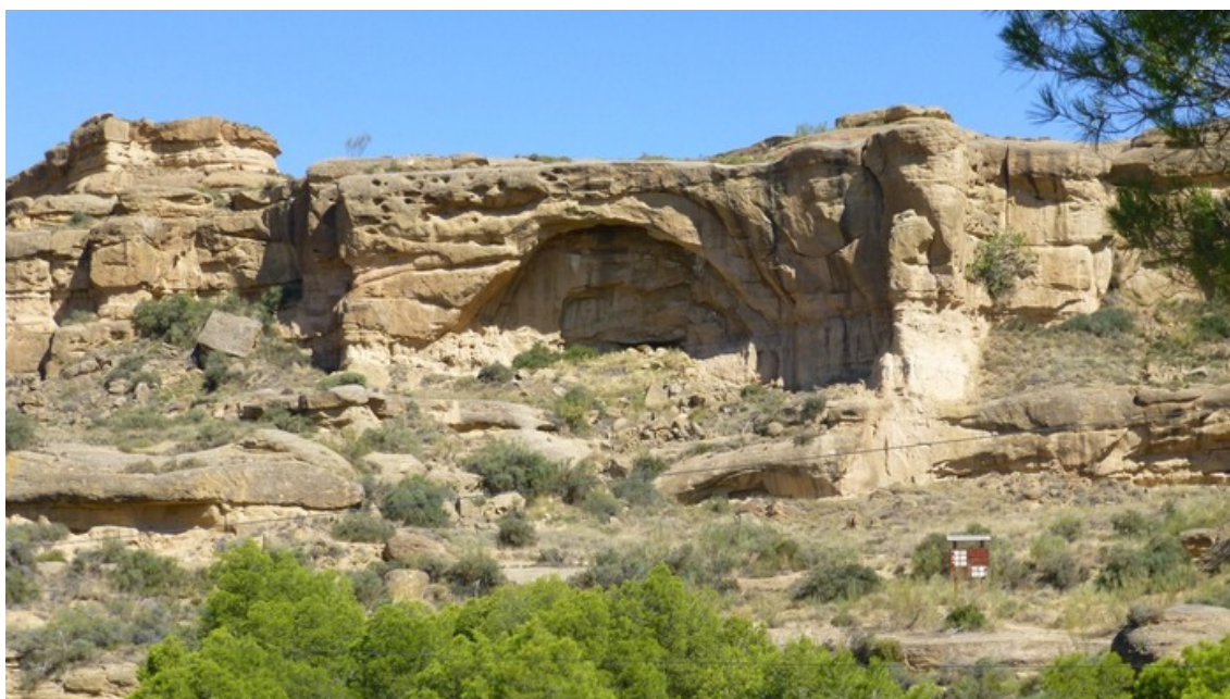
La Gabarda.