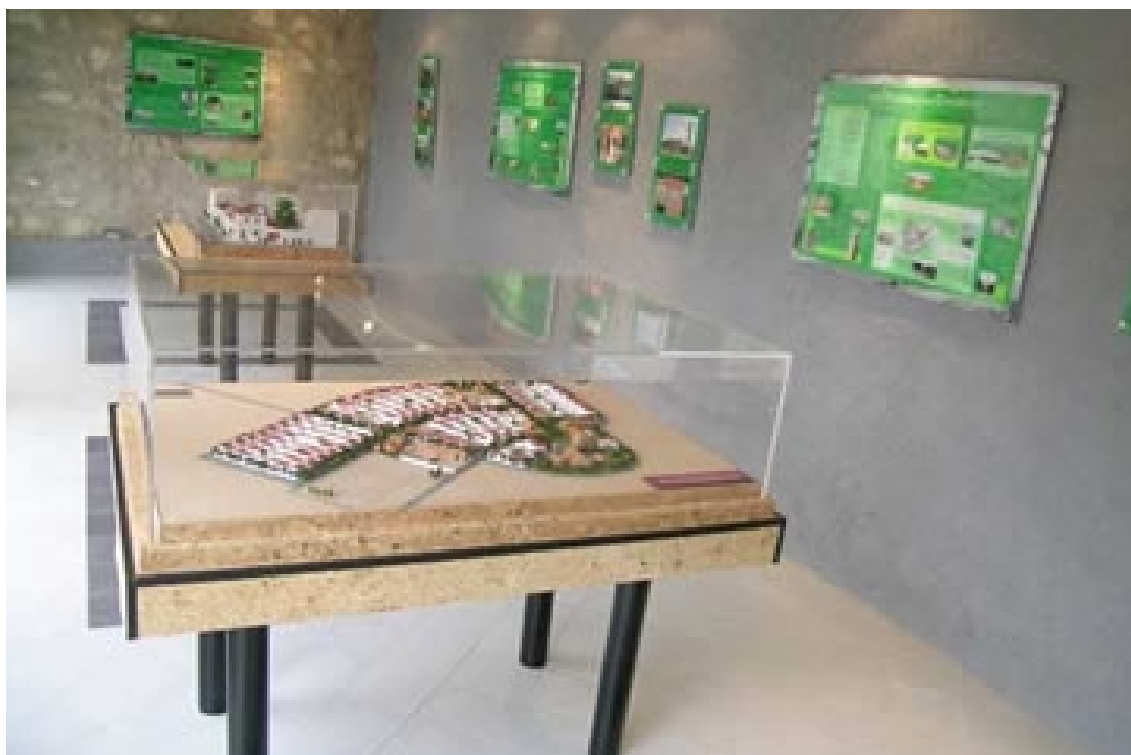
Centro de Colonización Agraria.