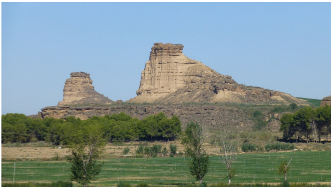
Torriones de La Gabarda.