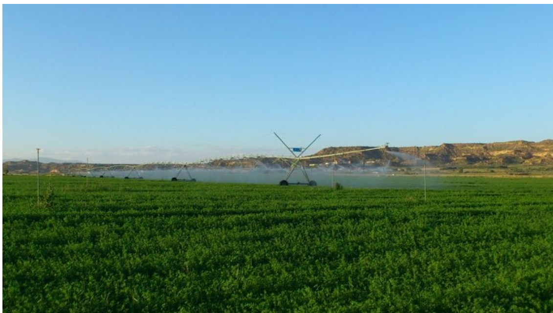
Nuevos reagadíos.