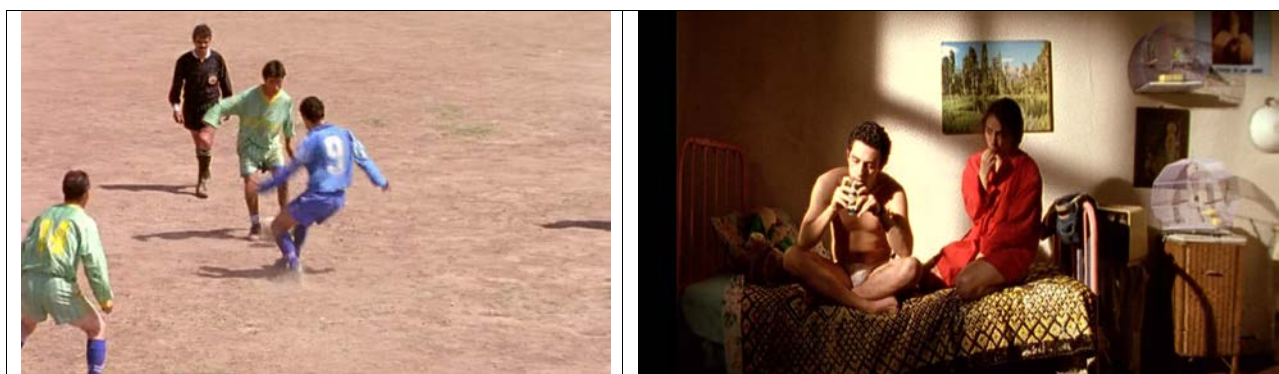
Figura 3. Fotogramas extraídos de Historias de Fútbol .

Además, esta sección puede utilizarse desde una visión paisajística donde se dibuja la silueta de la cordillera andina, ceñida a la vida de los habitantes de la capital chilena, o desde una visión socioeconómica mostrando los establecimientos comerciales tradicionales, los cuales subsisten a pesar de otros modelos de consumo dentro de la sociedad chilena 1 .