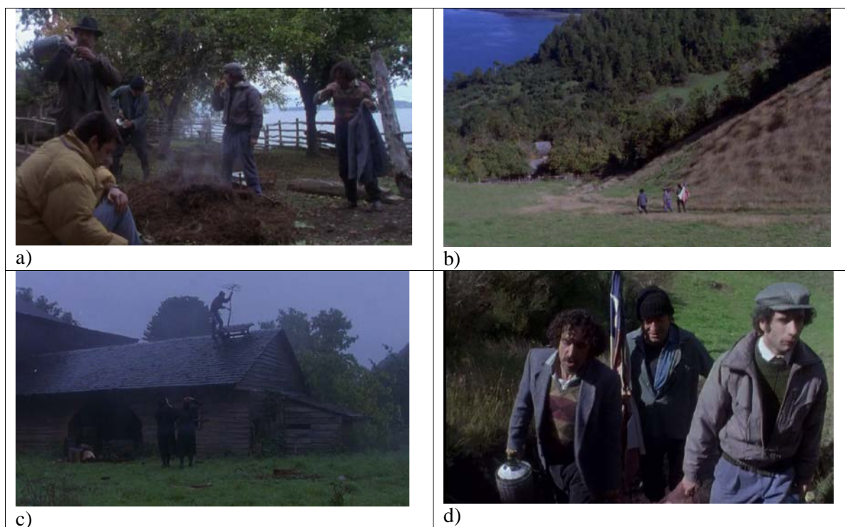
Figura 5. Fotogramas extraídos de Historias de Fútbol .

El largometraje, con sus tres episodios, es un gran material educativo para entender cómo las condiciones geográficas y también sociales marcan la vida de la gente. La película muestra la adaptación del ser humano en tres contextos geográficos: la adaptación a una ciudad grande, agobiante, violenta, en el primer capítulo; la adaptación al desierto, a las altas temperaturas y a la ociosidad, en el segundo; y la adaptación climatológica, en cuanto a frío y lluvia, y de aislamiento territorial, en el tercero; evidenciando así que, a pesar de lo uniforme que es Chile a nivel lingüístico, las diferencias propias de los territorios y climas del país son evidentes. Manifestaciones del Chile cotidiano se resumen en elementos como la representación de la bandera nacional (figura 5d), fuera del contexto institucional (Peirano, 2005) convirtiéndose en una expresión de afirmación identitaria; la identidad nacional se fortalece a través de los éxitos deportivos, además de homogeneizar el pensamiento y crear lazos comunes entre la gente.