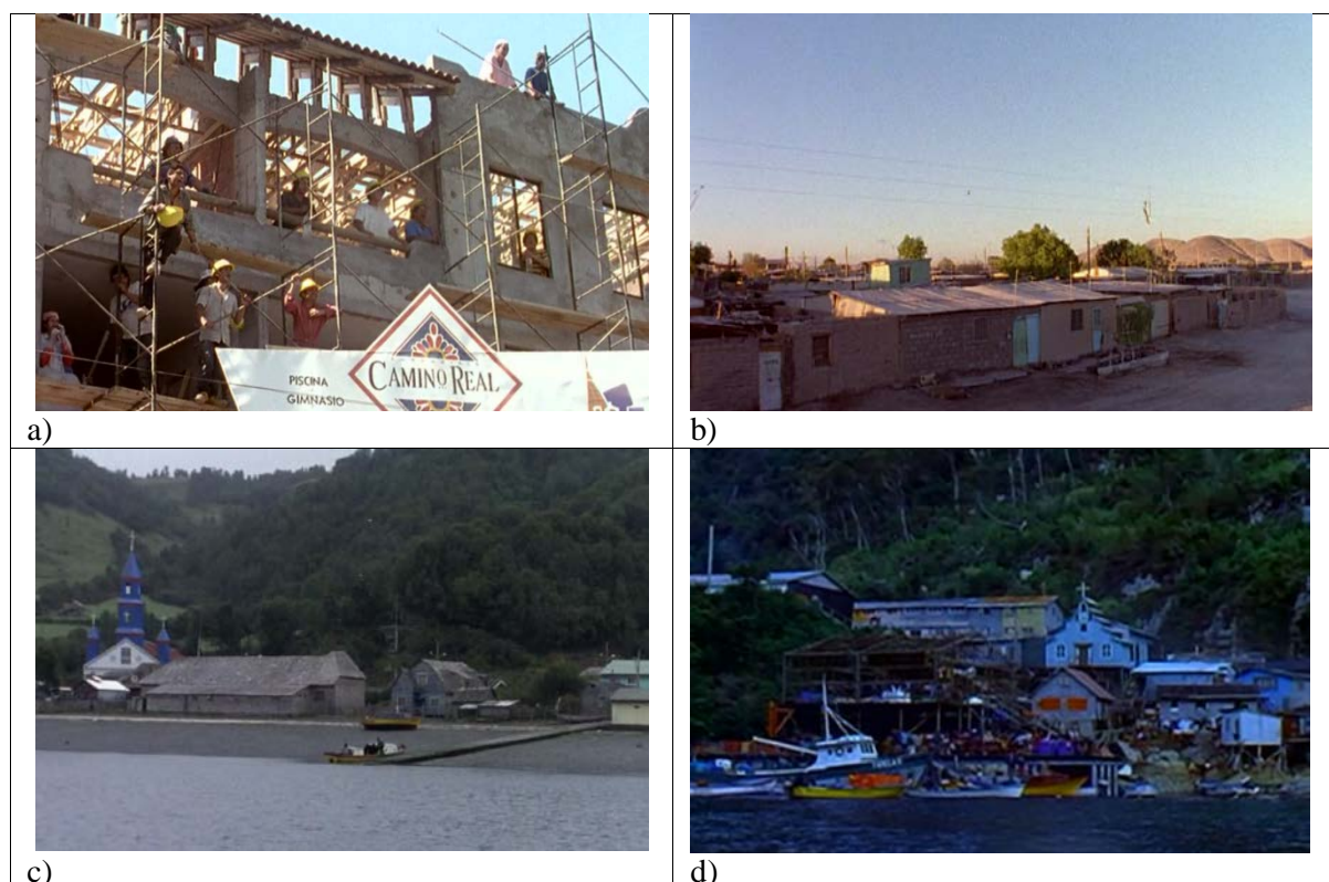
Figura 1. Localizaciones de las películas de Andrés Wood. a) Historias de fútbol , primer capítulo (Santiago de Chile, XIII Región); b) Historias de fútbol , segundo capítulo (Calama, II Región); c) Historias de fútbol , tercer capítulo (Chiloé, X Región); y d) La fiebre del loco (Puerto Gala, Aysén, XI Región). Elaboración propia

La figura 1 permite ver las diferentes localizaciones de las películas que se analizan en este trabajo, desde la gran urbe (a), a una ciudad minera (b) y los paisajes rurales del sur (c,d).