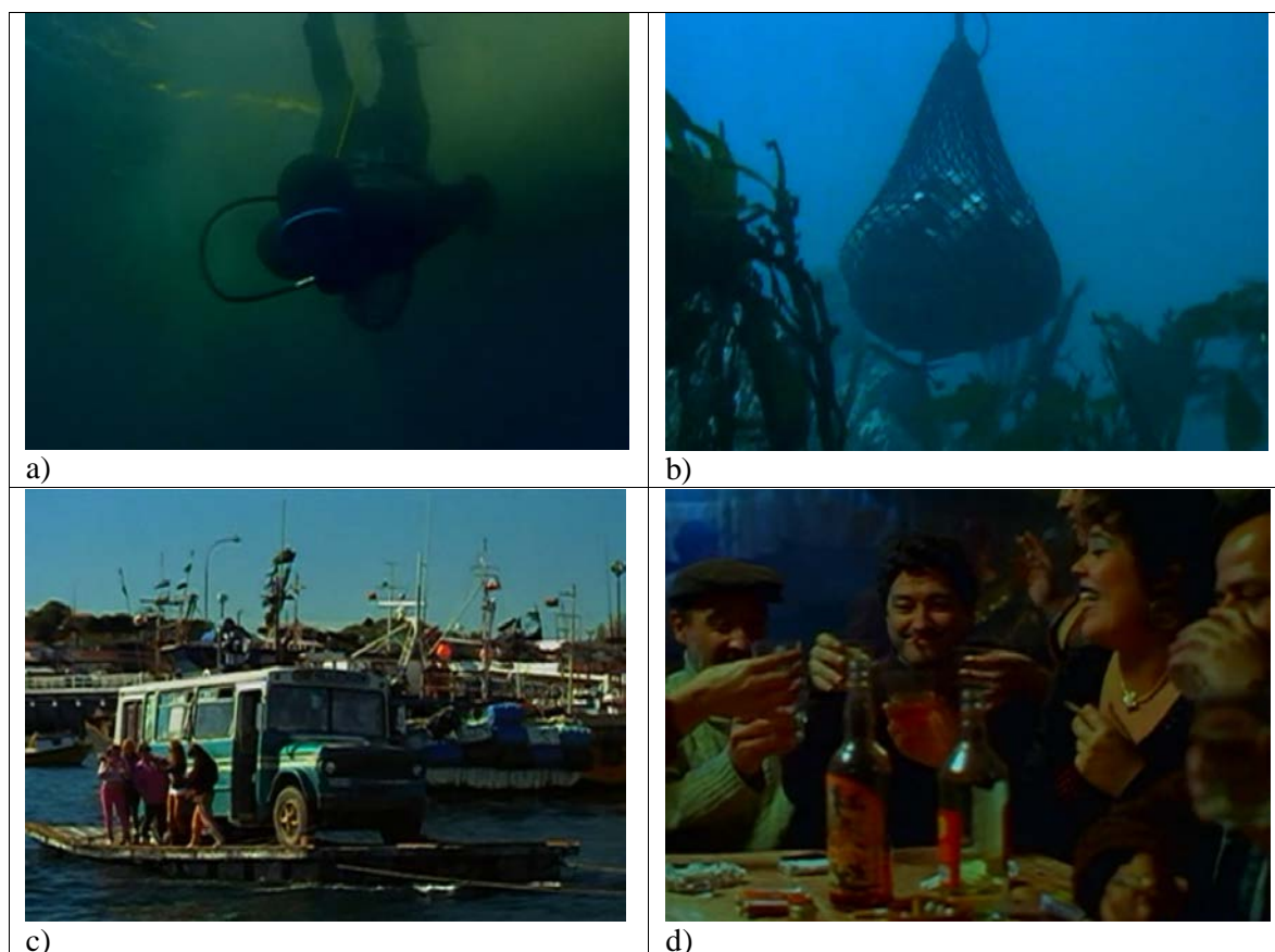
Figura 6. Fotogramas extraídos de La fiebre del loco .